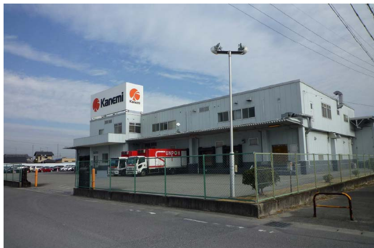
カネ美食品岡崎工場 160112